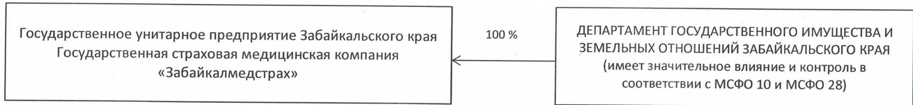
Схема взаимосвязей акционеров (участников) НФО и Лиц, под контролем либо значительным влиянием которых находится НФО